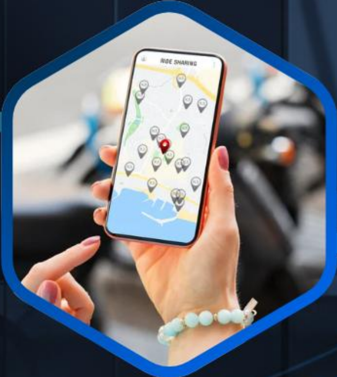
APP de Mobilidade