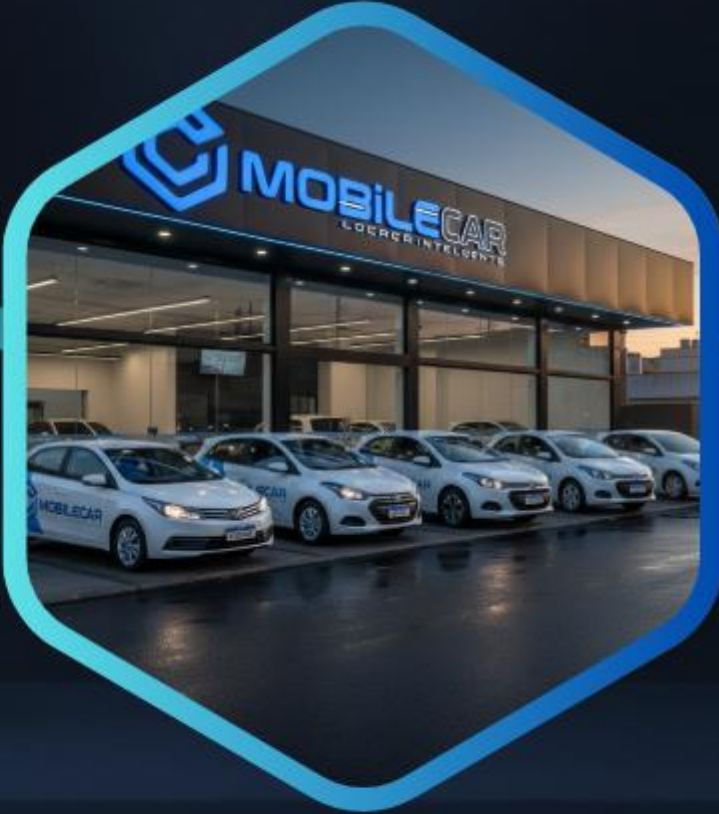
Redes de Lojas